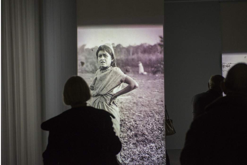
BesucherInnen bei der Eröffnung, Foto: Sebastian Bolesch

Die präsentierten Texte sind unabhängige AutorInnentexte und geben nicht in jedem Fall die Meinung des Humboldt Lab Dahlem wieder. Die Rechte liegen, wenn nicht anders angegeben, beim Humboldt Lab Dahlem. Hinweis für die PDF-Druckversion: alle Links sind auf den entsprechenden Unterseiten von www.humboldt-lab.de abrufbar.