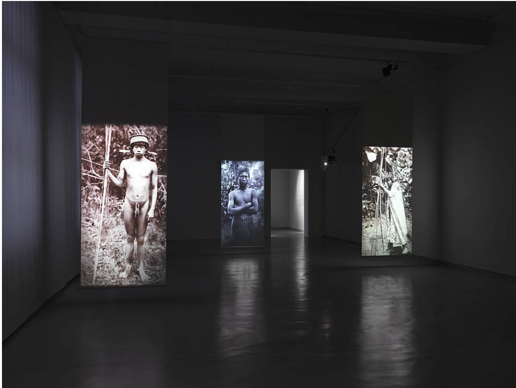
Installationssansicht „Fotografien berühren“