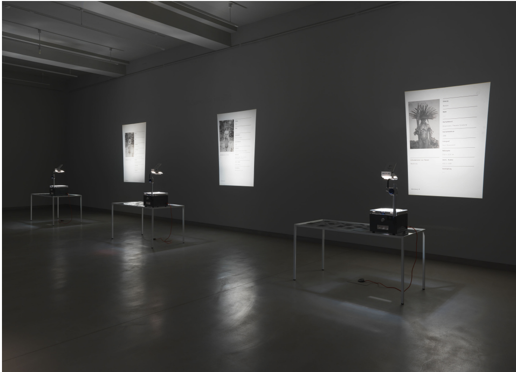
Installationssansicht „Fotografien berühren“